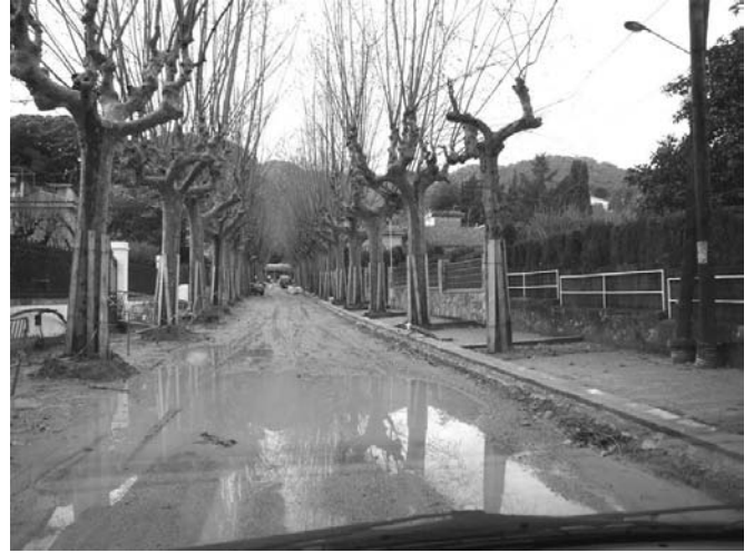
Abans de les obres

Qui no viu allà o no hi passeja, no es pot adonar del canvi d'una zona plena sots, pols o fang, (segons la meteorologia) convertida ara en una magnífica zona asfaltada i moderna respectant l'entorn: nous enllumenat, clavegueram i asfaltat del carrer. Aquesta obra ha estat finançada un 90% pels veïns i un 10% per l'Ajuntament.