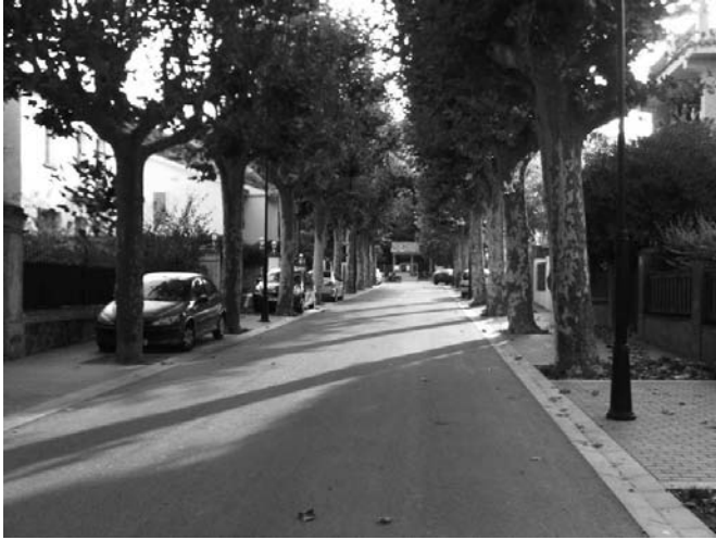
Després de les obres