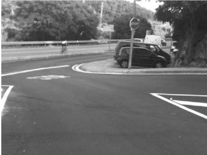
Carrer Dos de maig amb ronda de Llevant: la modificació del ferm permet, ara, el pas de l'autobús que abans de l'obra era inviable.

Amb la pacificació del carrer gran i el canvi forçat d'itinerari del bus (desviant-lo del centre en benefici de la zona de vianants que tant gaudim), el grup de TxA ha mostrat, una vegada més, el compromís d'escoltar les persones. Atenent les demandes de nombrosos usuaris s'ha posat en funcionament el