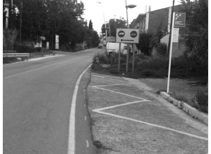
Parada a Sant Sebastià de Baix

nou itinerari del bus a Mataró. Per fer-ho possible calia una obra de millora al final del carrer Dos de Maig que ja és una realitat. Ara, els veïnats entorn el turó de Sant Sebastià tenen noves parades d'aquest autobús: Sant Sebastià de Baix, carrer Nou, CAP i Ronda de Llevant.