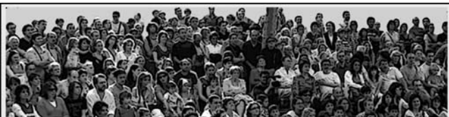
Reunió de poble

Nosaltres en diem manipulació perquè dels vessants quantitatiu/qualitatiu del procés, primer ens van vendre que la qualitat estaria per sobre de la quantitat. I, a la vista que els resultats qualitatius no els ajudaven, la quantitat va passar per davant de la qualitat. I els membres del Consell de la Vila, com a convidats de pedra. Lleig, molt lleig!