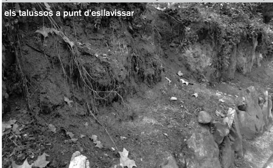
els talussos a punt d'esllavissar

Però d'això ja en parlarem un altre dia.