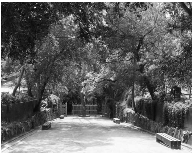
Així lluïa la Font el març de 2011.

Aquesta és la millor aposta de futur per a la Font Picant. Potser no és nova , però és la més moderna perquè és ecològica i sostenible. Qui cregui que fent una Font Picant nova aconseguirà millorar l'actual, s'equivoca. Ara, després de tres anys, ja poden treure el cartell de "hi estem treballant", ja tenim la Font Picant que volem, la de tota la vida!