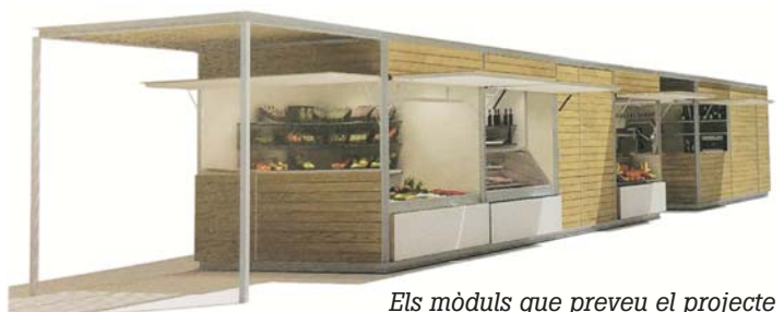
Els mòduls que preveu el projecte