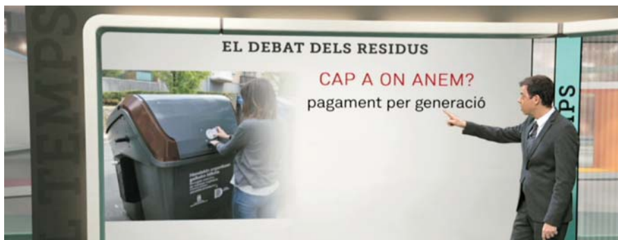
Els informatius de TV3 fent-se ressò del pagament per generació

L'Agència de Residus de Catalunya ja fa molts anys que treballa en aquesta línia. Argentona va entrar a formar part d'un grup de